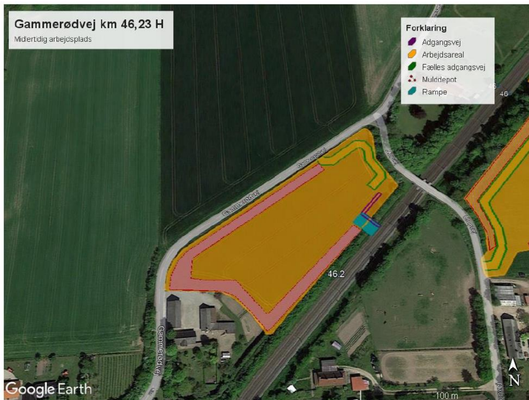
Kort 5: omrids og indretning af arbejdsplads ved Gammerødvej