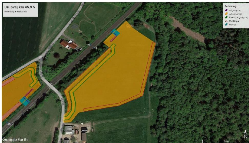
Kort 3: omrids og indretning af arbejdspladsen ved Urupvej