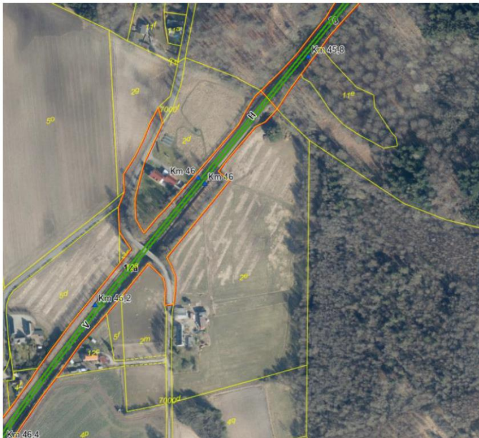
Kort 4: matrikelkort ved Urupvej