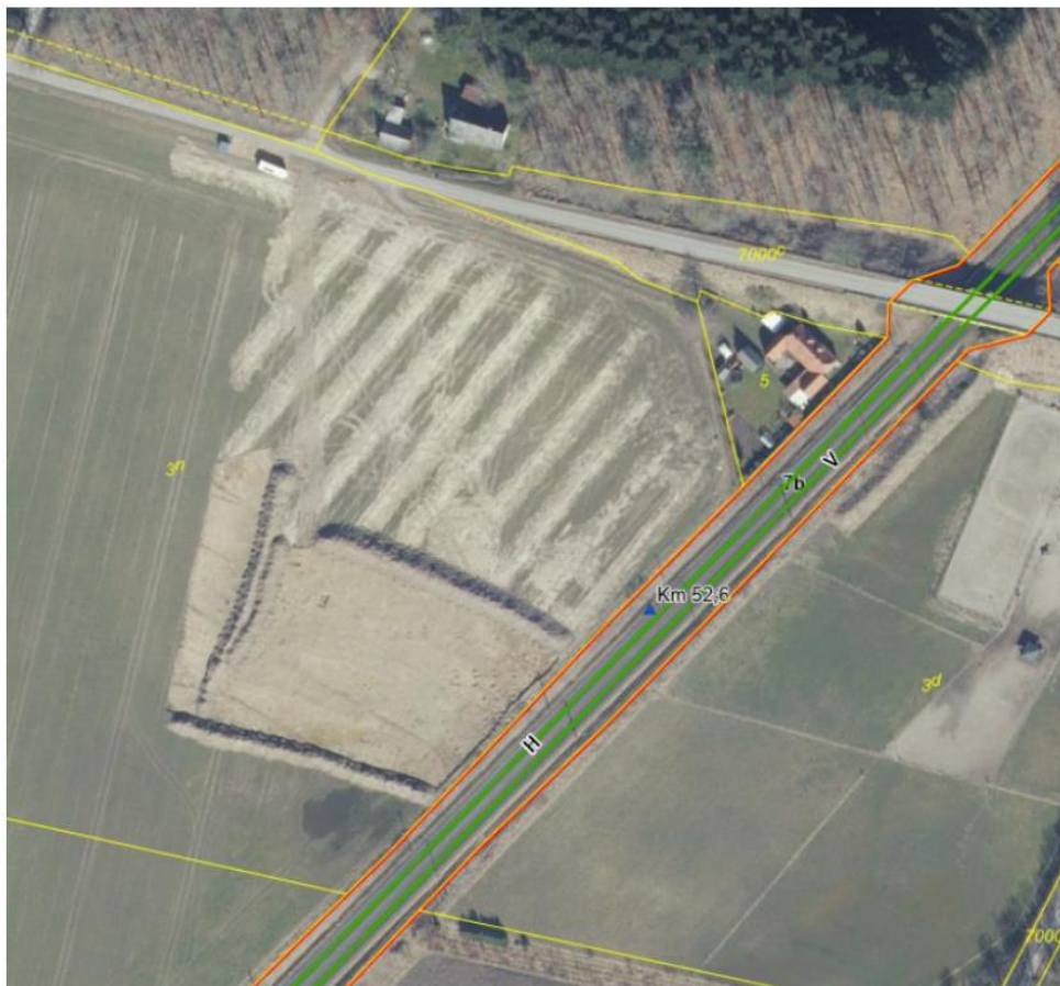
Kort 12: matrikelkort ved Dyrehavevej