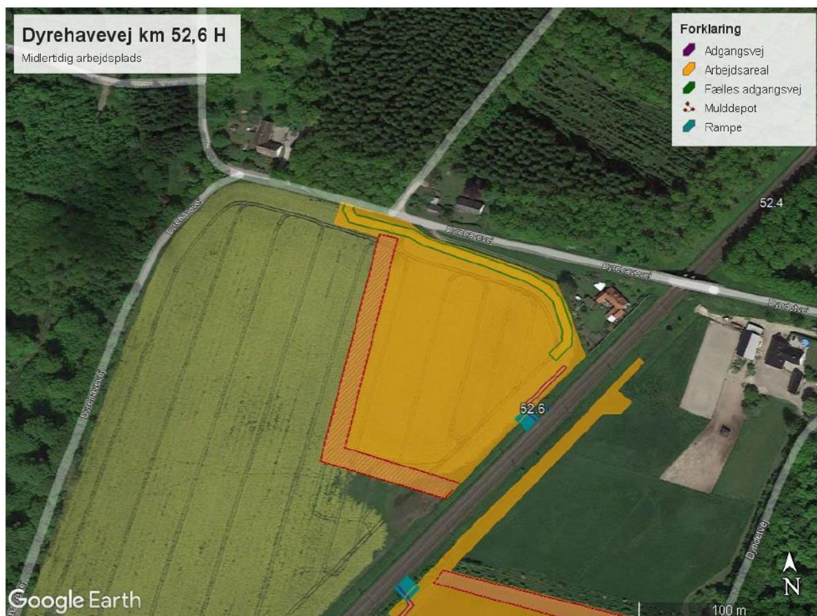
Kort 11: omrids og indretning ved Dyrehavevej