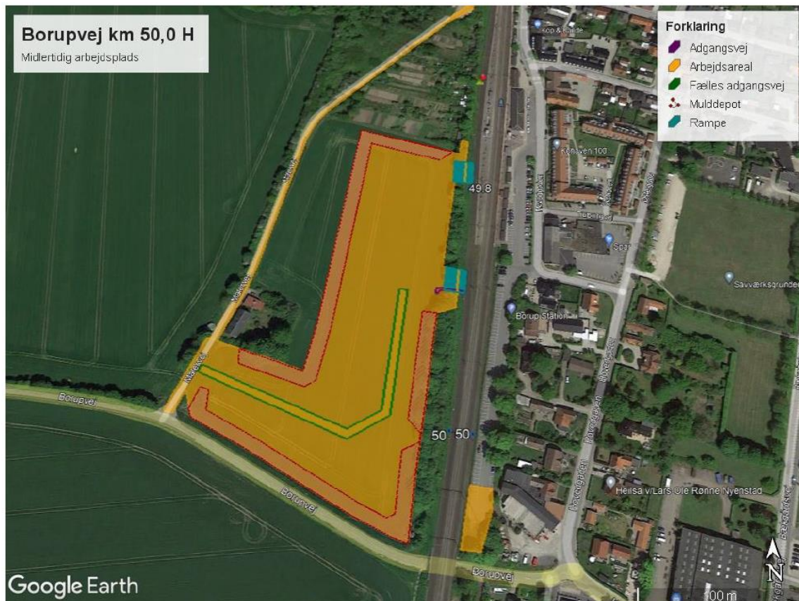
Kort 9: omrids og indretning ved Borupvej