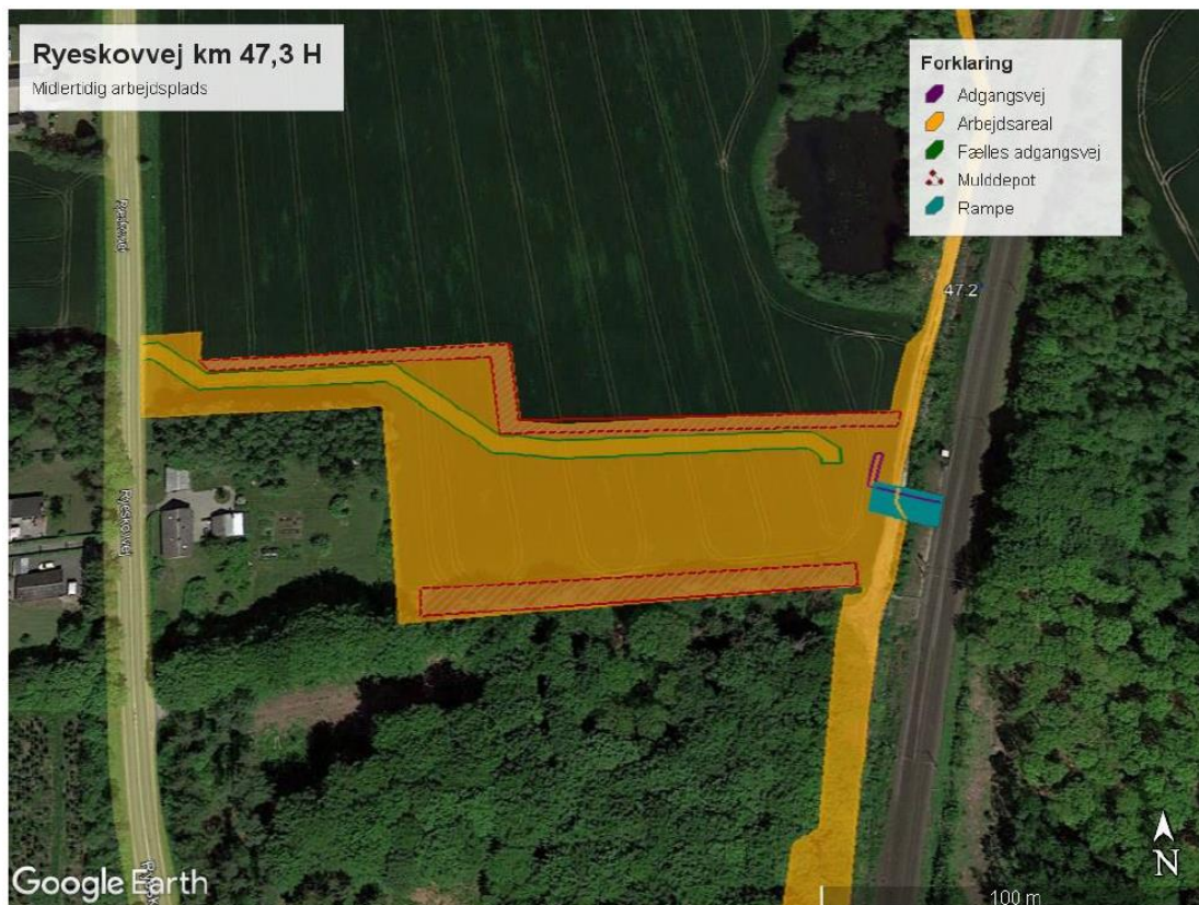
Kort 7: omrids og indretning af arbejdsplads ved Ryeskovvej