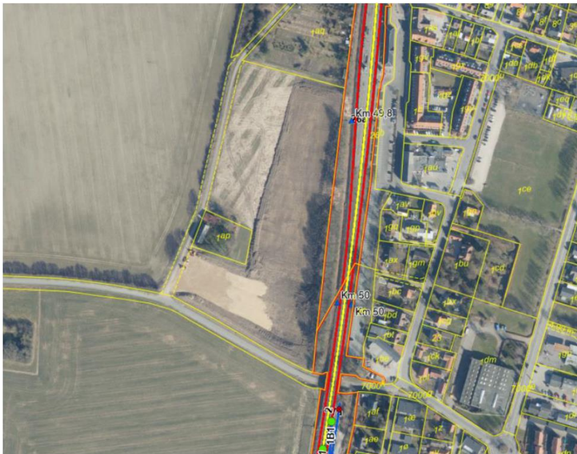
Kort 10: matrikelkort ved Borupvej