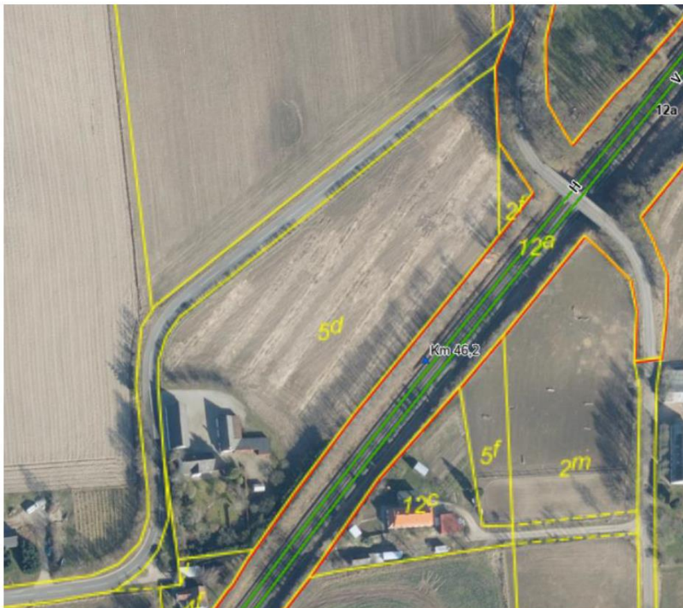
Kort 6: matrikelkort ved Gammerødvej