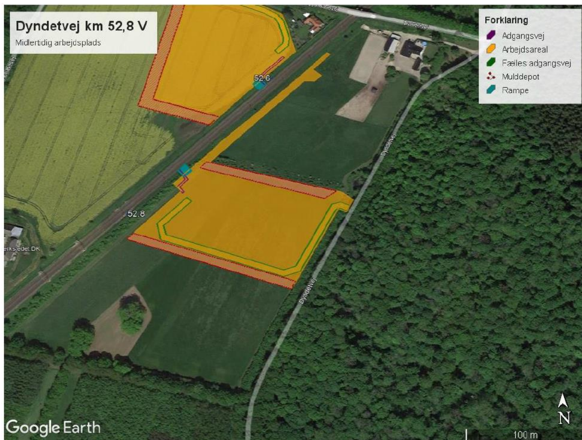
Kort 13: omrids og indretning ved Dyndetvej