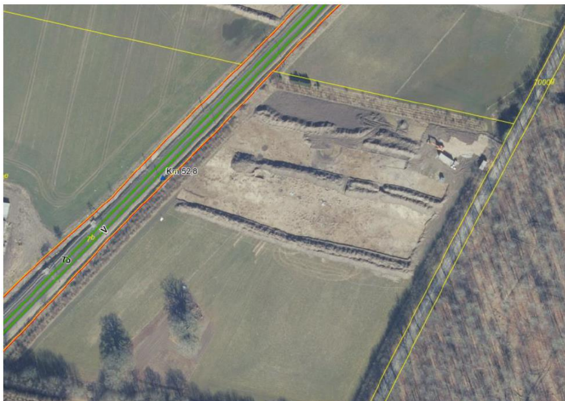
Kort 14: matrikelkort ved Dyndetvej