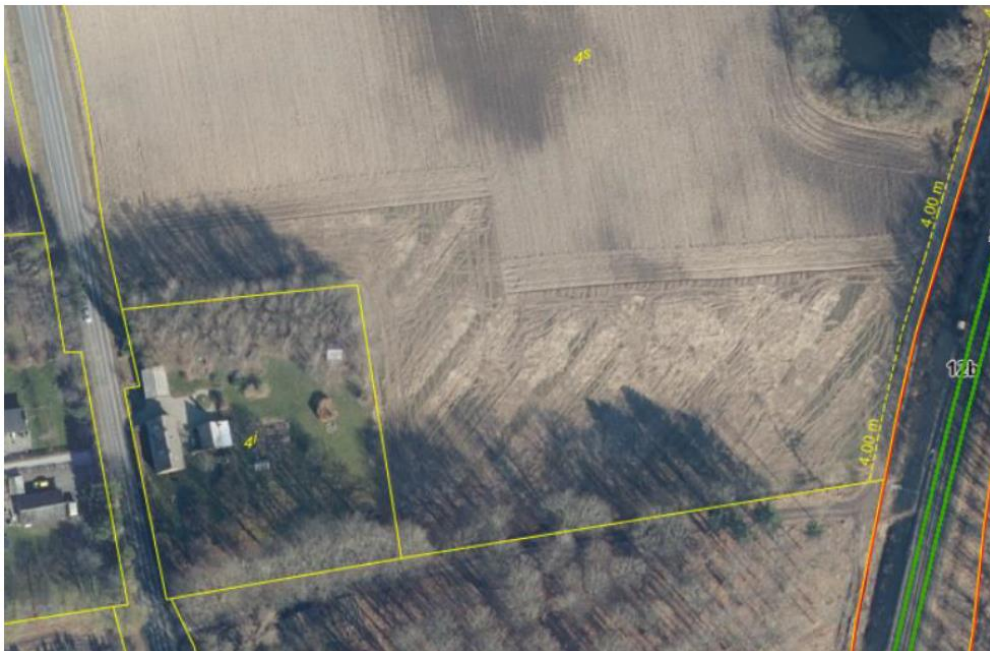
Kort 8: matrikelkort ved Ryeskovvej