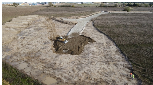
Etableringen af den 800.000 tons tunge jordvold er i fuld gang. På toppen vil der være udsigt over hele området.

Det er virksomheden RGS Nordic, der står for opførelsen af volden, som vil bestå af ren jord. Jordvolden vil på sit højeste punkt nå godt 18 meter. Mens volden ind mod boligområdet vil skråne med mulighed for ophold og færdsel, vil den være anderledes stejl og tættere beplantet ind mod erhvervsområdet. Forventningen er, at jordvolden udbygges over en periode på op til fire år og færdiggøres i etaper fra syd mod nord.