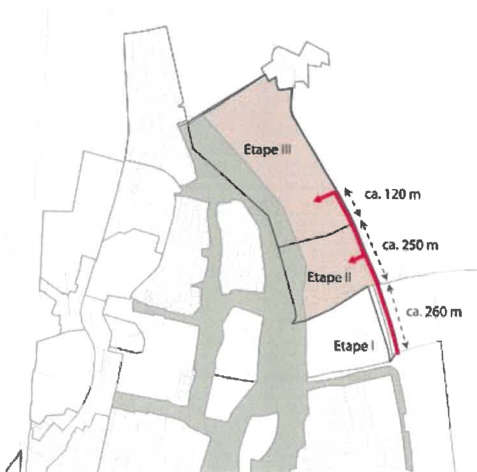
Figur 1 Oversigtskort

Ved paddesø på østlig side af tracéet, anlægges paddetunnel under vej i retning mod Kimmerslev Møllebæk. Herved kan padderne bruge den grønne kile mellem etape 2 og 3, som spredningskorridor.