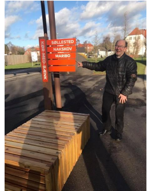
"Kør-mæ-bænk" i Horslunde