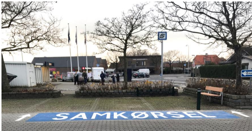
Eksempel fra Slangerup st.