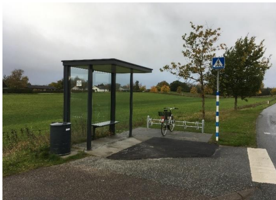
Cykelparkering ved landstoppested i Køge Kommune

* Læs mere om cykelparkering ved stoppesteder og den tilhørende effekt på: https://www.moviatrafik.dk/media/5603/superskiftet-guide-til-god-cykelparkering.pdf