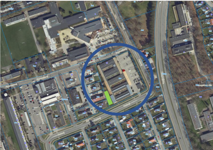
Skolen ønskes etableret i den sydlige, tværgående længe af bebyggelsen. Det skitserede legeområde er vist med grønt.