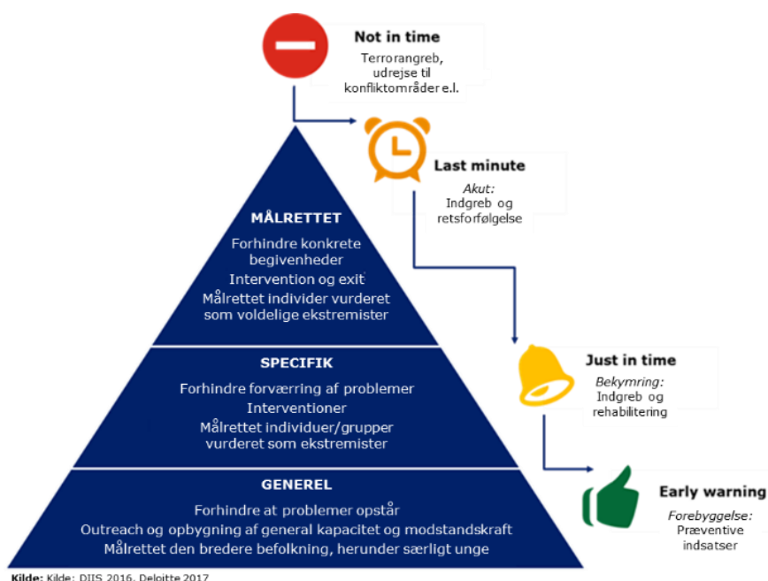
Figur 2: Forebyggelsestrekanten

Handleplanen skal bidrage til at understøtte Køge Kommunes samlede forebyggelsesindsats fra at udøve generel forebyggelse med henblik på at forhindre, at problemer opstår, til kommunens akutte håndtering af konkrete sager, hvor menneskeliv kan være på spil.