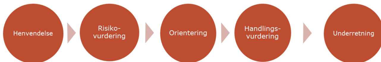
Figur 3: Sagsgang ved akutte bekymringshenvendelser

Sagsgangen beskriver, hvordan Infohus Køge håndterer sager, der kategoriseres som akutte. En akut sag er når alvorsgraden vurderes til at være af så hastende karakter, at der skal foretages umiddelbar handling af politimæssig karakter. I akutte sager sikrer Midt- og Vestsjællands Politi og Infohus Køge en koordineret øjeblikkelig indsats. Sagsgangen ses overordnet illustreret i nedenstående figur 3.