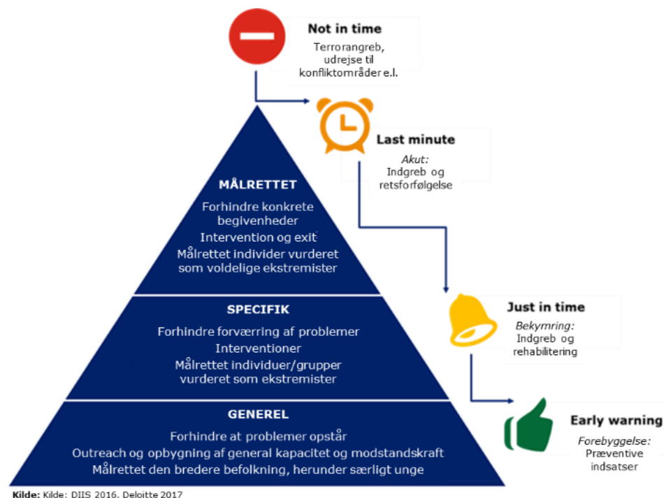
Figur 2: Forebyggelsestrekanten

Indsatsen sammenfattes under tre overskrifter (kilde: NCFE):