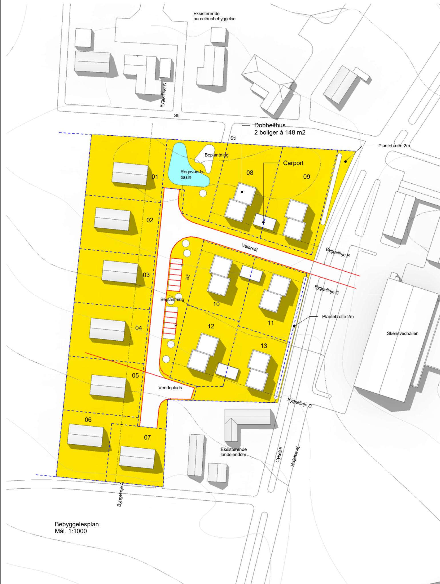
Bebyggesplan Mål. 1:1000