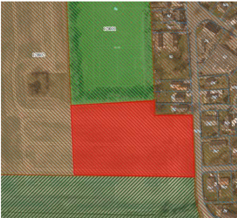
Algestrup 1,5 ha 35 boliger (markeret med rødt)

Nyudlægget til boliger i Algestrup reduceres til 1,5 ha med 35 boliger og nyudlægget i Ll. Skensved reduceres til 3,0 ha med 35 boliger. De to områder kan udvikles efter 2021.