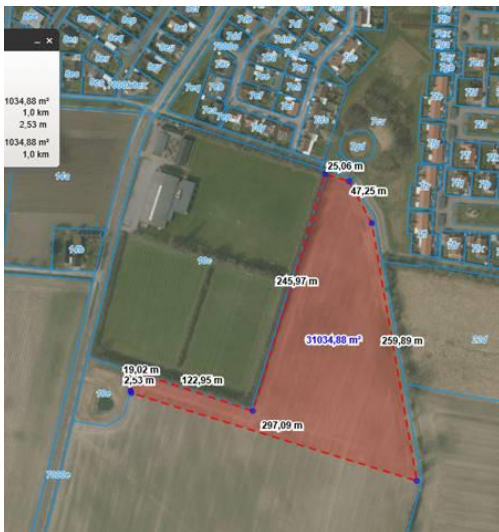
Lille Skensved 3,0 ha 35 boliger (markeret med rødt)

Nyudlægget på 11 ha til boliger i Herfølge udtages (arealet indgår i forslag til Fingerplan 2019, der aktuelt er i offentlig høring).