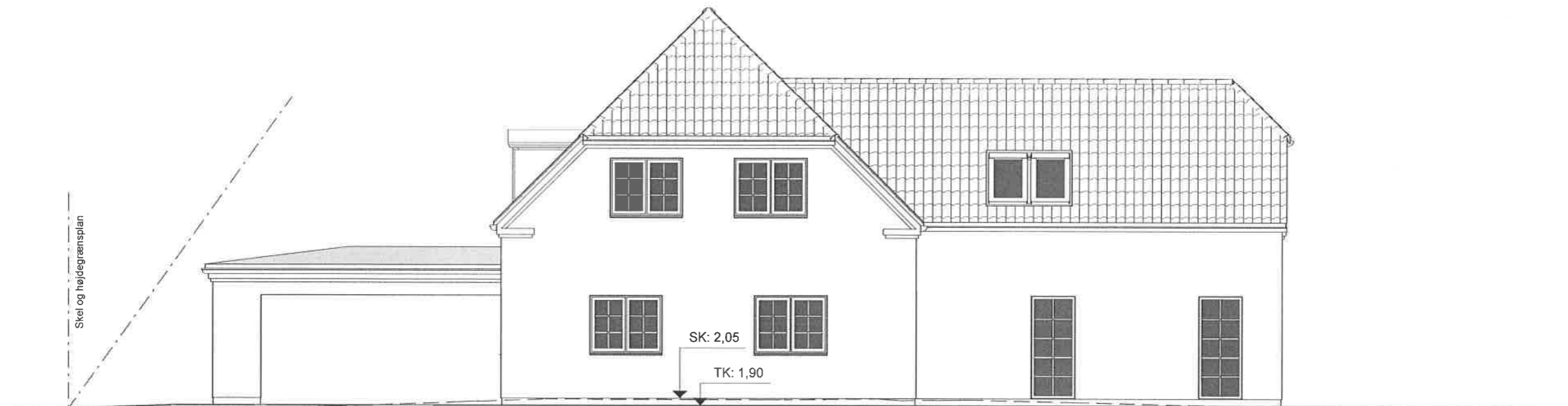
Gavl mod øst