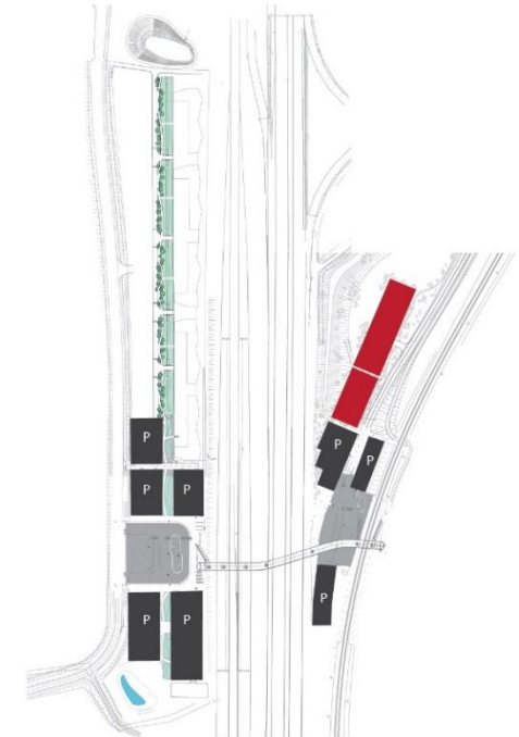
Ny figur 11. Parker og rejsanlægget kan i en senere etape udbygges med flere parkeringspladser øst for motorvejen

Nummerering af efterfølgende figurer konsekvensrettes.