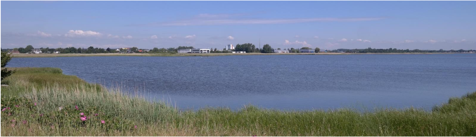
Fremtidige forhold set fra adgangsvej til Ølsemagle Revle.