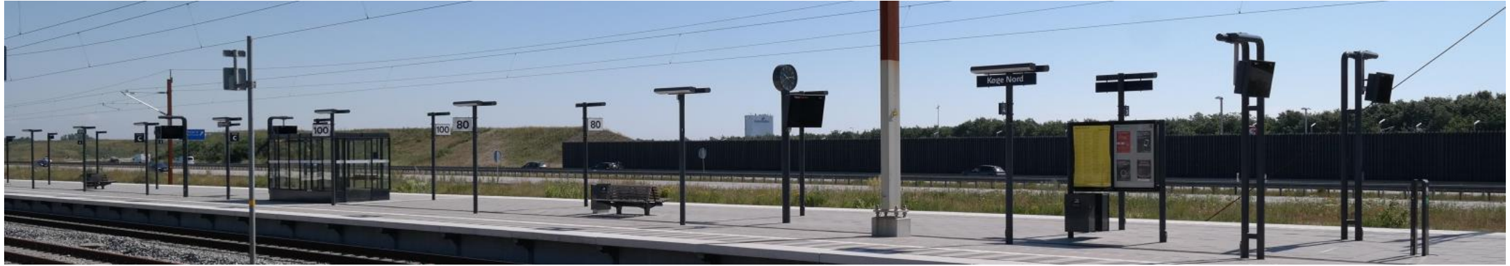
Fremtidige forhold set fra perronen ved Køge Nord station.