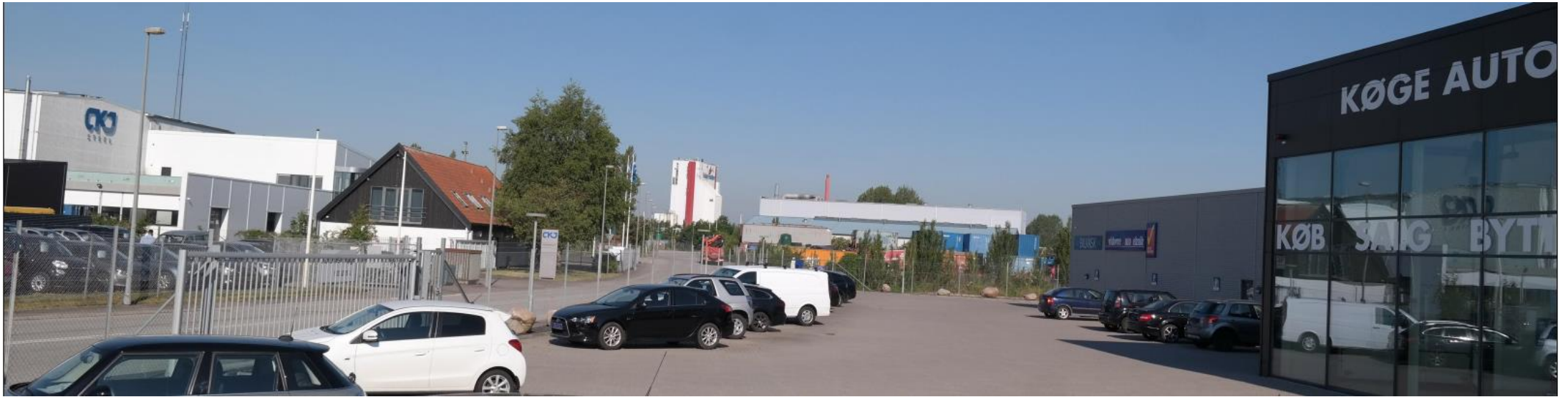
Fremtidige forhold set fra Københavnsvej/Industrivej – udvidelsen er ikke synlig.