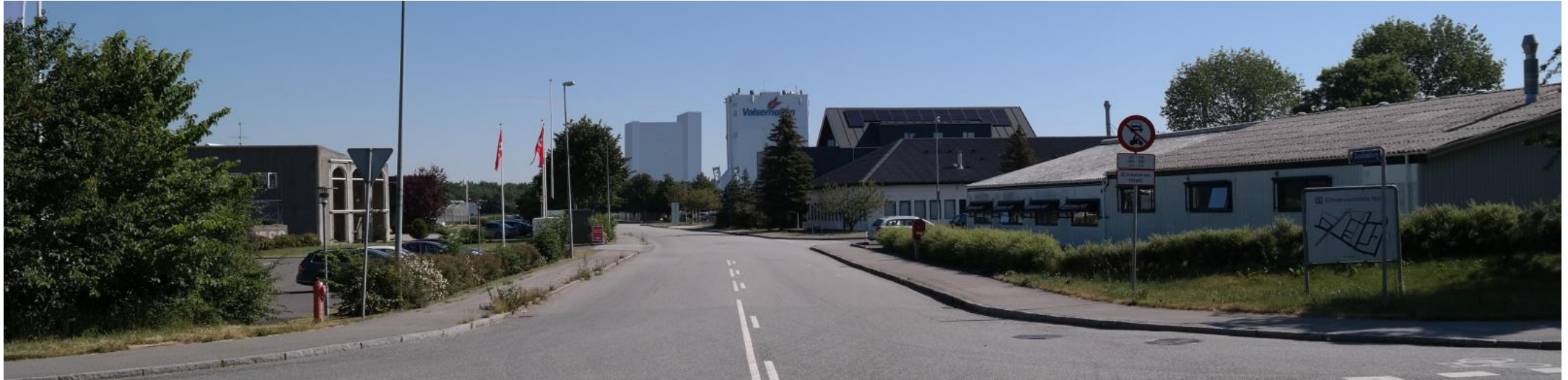
Fremtidige forhold set fra Egedesvej/Sandvadsvej.