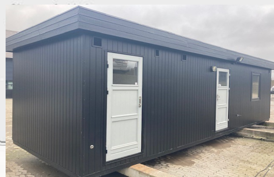
Eksempel på pavillon med toiletter (ca. 9x3 meter)