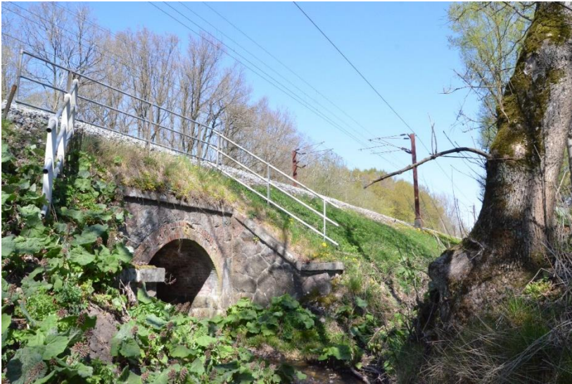
Foto 1: Besigtigelsesfoto af Klemme Bro