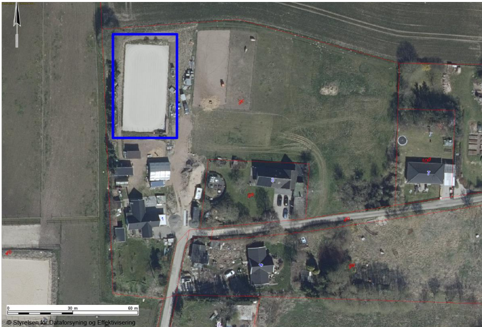
Kort 2: Ridebanens (20 x 40 meter) placering på ejendommen markeret med en mørkeblå firkant.