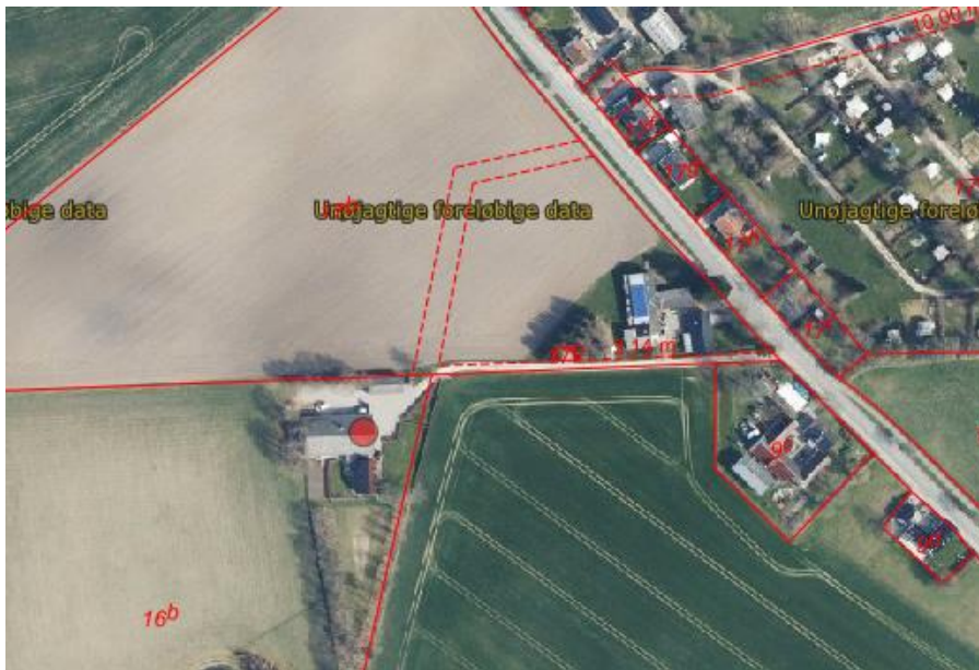
Den røde prik angiver ejendommens beliggenhed – Slimmingevej 57