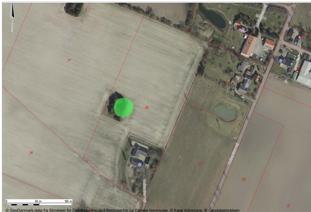
Kort 2: Omtrentlig placering af den nye sø på ca. 1000 m 2 (grøn prik) på ejendommen. Ikke målfast.

Køge Kommune har modtaget din ansøgning om landzonetilladelse til etablering af en sø på ca. 1000 m 2 på adressen Volderslevvej 28, 4100 Ringsted til fremme for biodiversiteten i området.