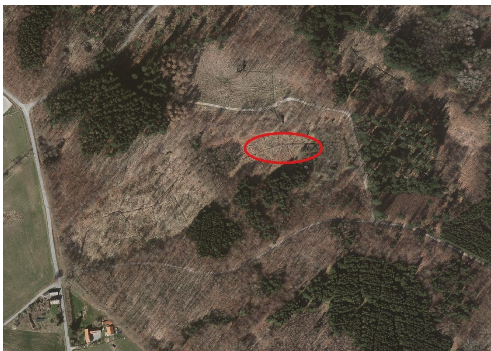
Figur 2. Den røde ellipse angiver den omtrentlige placeringen af den nye sø.

Projektområdet er ikke beliggende inden for et Natura2000-område.