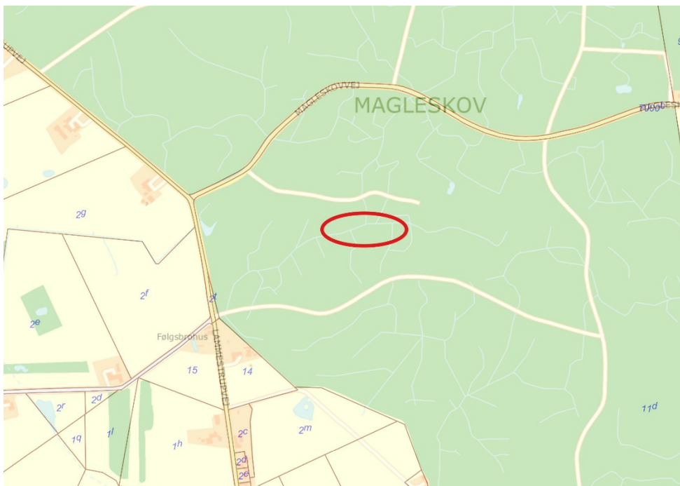
Figur 1. Viser matriklen med projektet.

Skovgrøfterne fra nord og øst skal føre vand til søen. Der etableres et overløb i den sydvestlige ende ud i et allerede etableret dræn ud i grøften. Søen anlægges med et areal på godt 3200 m 2 , med en fladt anlæg på ikke over 1:5 i gennemsnit og ikke stejlere end 1:3. Søen graves med en gennemsnitlig dybde på 1 m og med maksimum dybde på 1,5 m. Der oprensnes til fast bund i grøfterne, der fører vandet væk fra søen.